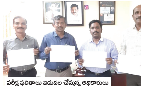
పరీక్ష ఫలితాలు విడుదల చేస్తున్న అధికారులు

19.02.22 (మీడియా సెల్) ఉభయ గోదావరి జిల్లాల్లోని ఆదికవి నన్నయ విశ్వవిద్యాలయం పరిధిలో డిగ్రీ 2వ సెమిస్టర్ పరీక్ష ఫలితాలను వీసీ ఆచార్య మొక్కా జగన్నాథరావు చేశారు.