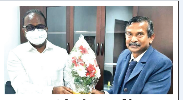
ప్రిన్సిపాల్ సెక్రటరీని కలిసిన ఓ.ఎస్.డి.