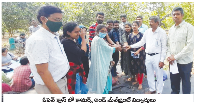
ఓపెన్ క్లాస్ లో కామర్స్ అండ్ మేనేజ్మెంట్ విద్యార్థులు

ఆదికవి నన్నయ యూనివర్సిటీ డిపార్ట్మెంట్ ఆఫ్ కామర్స్ అండ్ మేనేజ్మెంట్ స్టడీస్ విద్యార్థులకు రాజాసగరం రాధేయపాలెంలోని తోటలలో శనివారం ఓపెన్ క్లాస్ ను నిర్వహించారు. ఈ సందర్భంగా యూనివర్సిటీ ఓ.ఎస్.డి. మరియు విభాగ ఆచార్యులు ఎస్. టేకి మాట్లాడుతూ ఆదికవి నన్నయ విశ్వవిద్యాలయంలోని కామర్స్ అండ్ మేనేజ్మెంట్ స్టడీస్ విద్యార్థులకు ప్రతీ సెమిస్టర్ లో ఒకసారి ఓపెన్ క్లాసులను నిర్వహిస్తున్నామని అన్నారు. ఓపెన్ క్లాసుల ద్వారా విద్యార్థుల మానసిక స్థితి మారుతుందని ఒత్తిళ్ళు దూరమవుతాయని తెలిపారు. డిపార్ట్మెంట్ ఆఫ్ కామర్స్ అండ్ మేనేజ్మెంట్ స్టడీస్ సృజనాత్మకంగా నిర్వహించే ఓపెన్ క్లాసులతో విద్యార్థులకు మానవ మనుగడకు కారణమైన ప్రకృతిపై మక్కువ ఏర్పడుతుందని చెప్పారు. ఓపెన్ క్లాసులకు విద్యార్థులు ఎంతో ఆసక్తిగా హాజరవుతున్నారని తెలిపారు. యూనివర్సిటీలోని కామర్స్ అండ్ మేనేజ్మెంట్ స్టడీస్ లోని అన్ని కార్యక్రమాలకు సహకరిస్తున్న వీసీకి కృతజ్ఞతలు